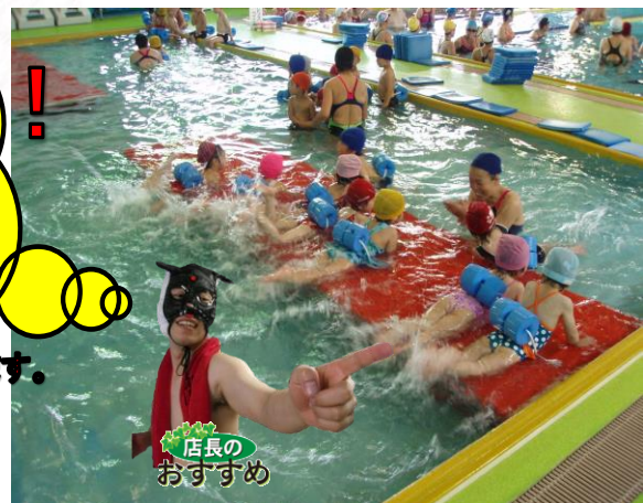
平成30年度営業・レッスンカレンダー